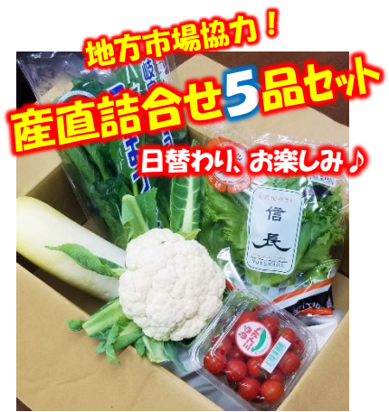
地方市場協力！ 産直詰合せ5品セット 日替わり、お楽しみ♪

◎ご(5)愛顧に感謝・・・地方市場全面協力！お楽しみ、産直詰合せ(5品)をお持ち帰り！