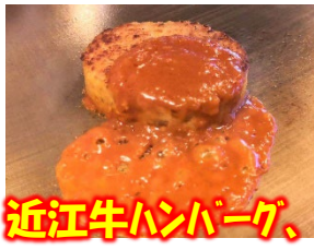
近江牛ハンバーグ、100g