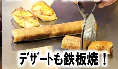
デザートも鉄板焼！