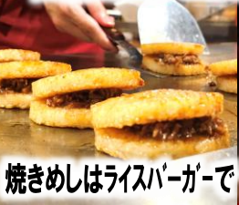
焼きめしはライスバーガーで