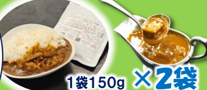
1袋150g × 2袋