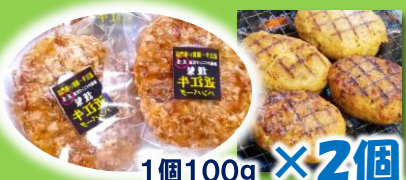
1個100g × 2個