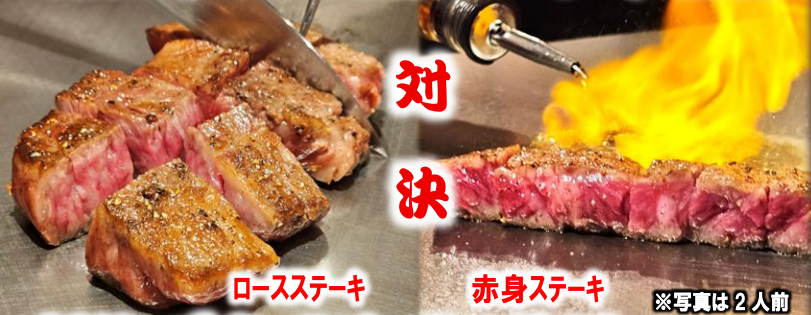
ロースステーキ 赤身ステーキ ※写真は2人前