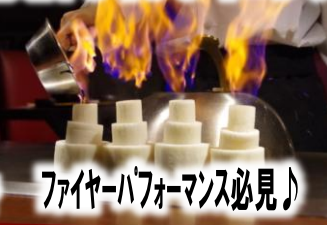
ファイヤーパフォーマンス必見♪